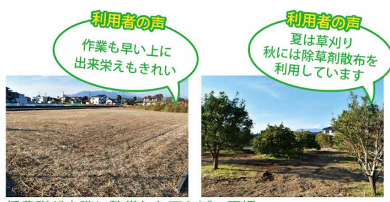
援農隊が実際に整備した田んぼ・圃場