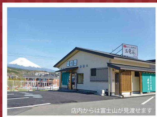
店内からは富士山が見渡せます

営業時間：11:00 ~ 14:00 定休日：毎週火曜日 駐車場：有り 座席数：24 席 TEL：055-992-2001