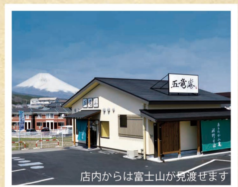
店内からは富士山が見渡せます

営業時間：11:00 ~ 14:00 定休日：毎週火曜日 駐車場：有り 座席数：24 席 TEL：055-992-2001