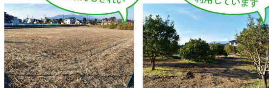
援農隊が実際に整備した田んぼ・圃場